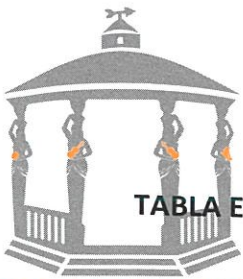
TABLA ESTADÍSTICA DE LA SEGUNDA SESIÓN DEL PRESENTE AÑO DE LA COMISIÓN EDILICIA DE PROMOCIÓN Y FOMENTO AL EMPLEO (PROMOCIÓN ECONÓMICA),